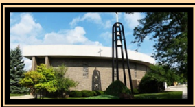
St. Barbara Church 4000 Prairie Avenue Brookfield, IL 60513

Parish Office 4008 Prairie Avenue Brookfield, IL 60513 708 485-2900 hgaparish.org