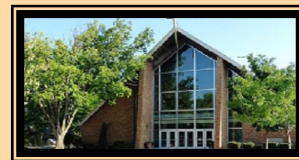
St. Louise de Marillac Church 1144 Harrison Avenue La Grange Park, IL 60526

Parish Office 4008 Prairie Avenue Brookfield, IL 60513 708 485-2900 hgaparish.org