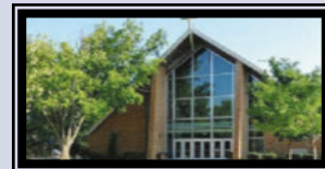
St. Louise de Marillac Church 1144 Harrison Avenue La Grange Park, IL 60526

Parish Office 4008 Prairie Avenue Brookfield, IL 60513 708 485-2900 hgaparish.org