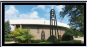
St. Barbara Church 4000 Prairie Avenue Brookfield, IL 60513

Parish Office 4008 Prairie Avenue Brookfield, IL 60513 708 485-2900 hgaparish.org